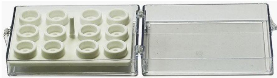
13-095012 EM-Tec SC12 透明スチレンボックス

The EM-Tec シリンダースタブストレージボックスは 9.5mm φ および 12.2mm φ のシリンダースタブに 取付けた SEM サンプルの保管用にデザインされています。彼らは小さい JEOL スタブとマウントの取扱い、長期保存、アーカイブ、および出荷 SEM サンプル用に使用することができます。試料の取扱い、長期保存、保管や移動のためにシリンダースタブを収納することができます。4 個と 12 個のスタブ用が用意されています。